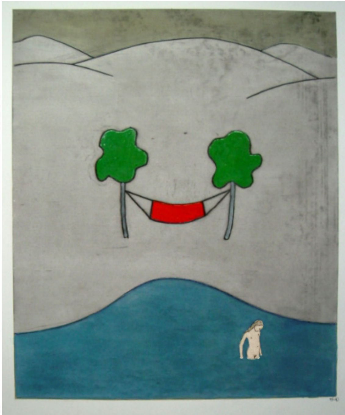
Hängmattan bemålad tornnål 45 x 60 cm