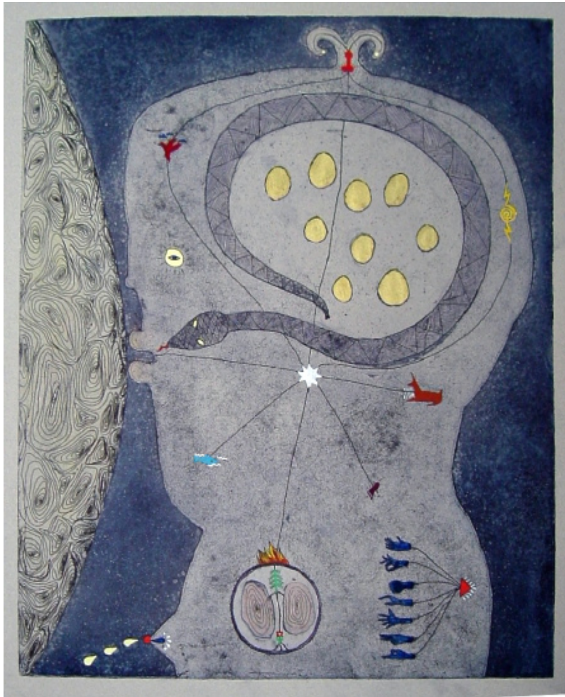
Från ingenting (?) till allt bemålad etsning 55 x 40 cm