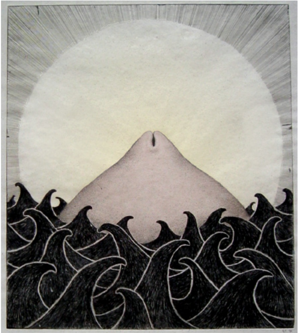
Venus födelse bemålad etsning 55 x 40 cm