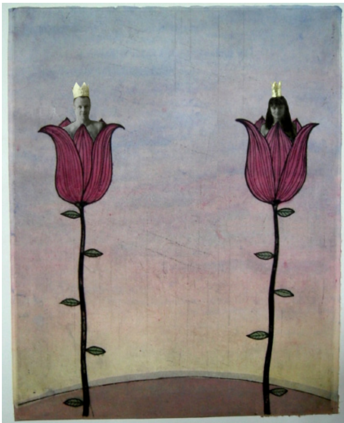
John och jag tornål och collage 60 x 45 cm