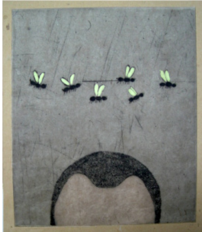
Flygmyrorna svärmar igen tornål 20 x 30 cm