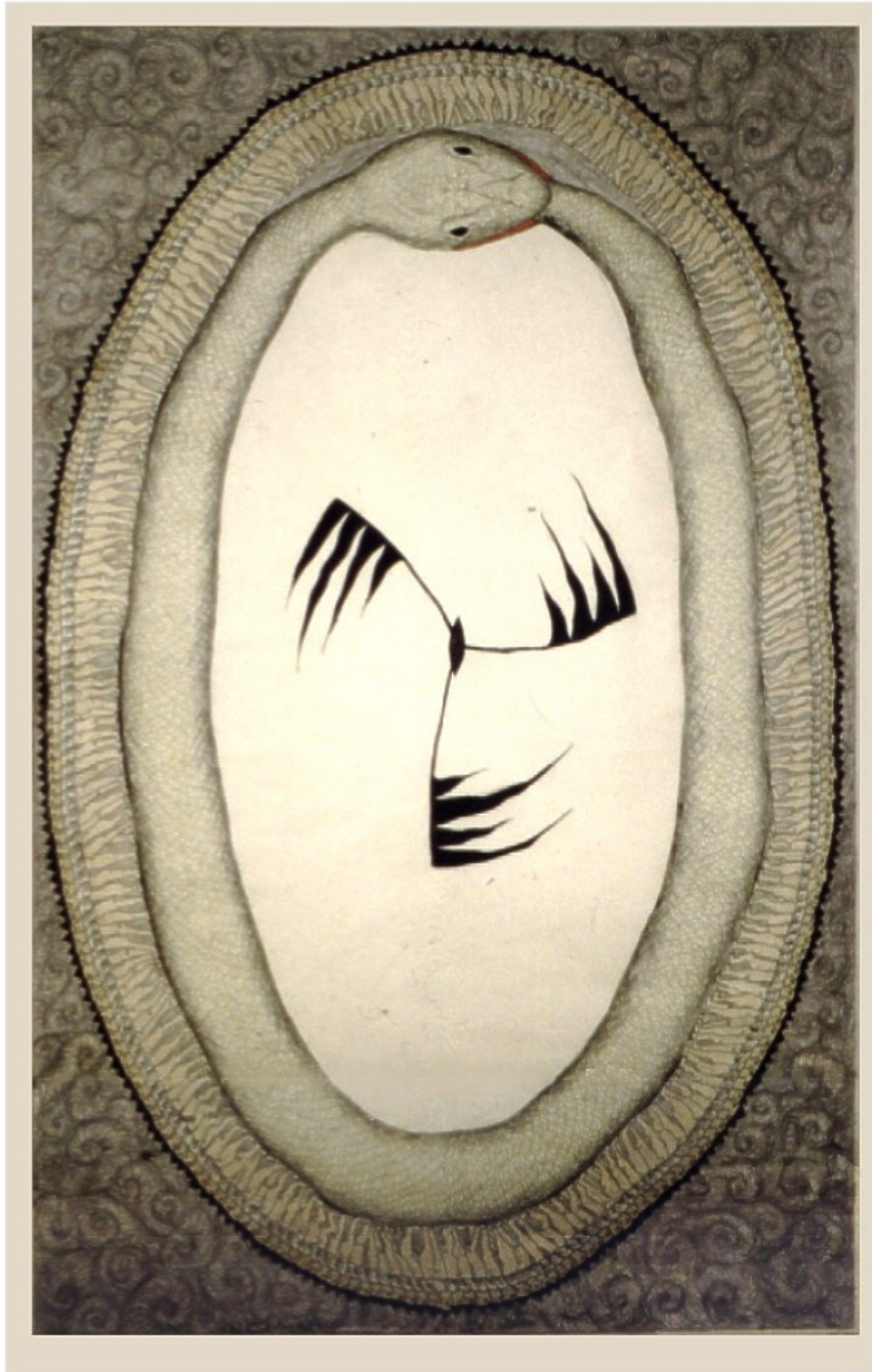
Allting börjar - allting börjar om bemålad etsning 65 x 40