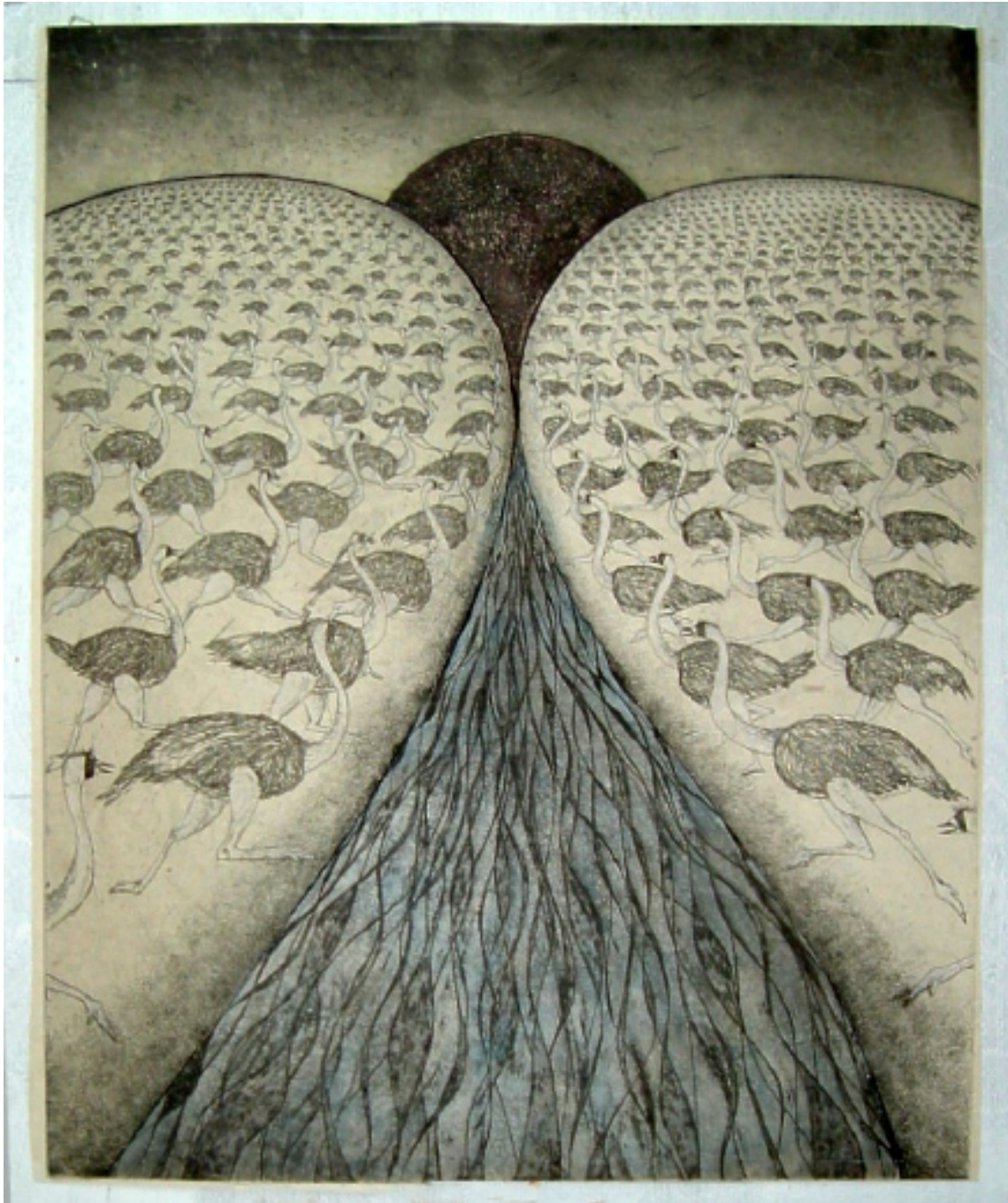
Ska vi hålla på så här bemålad etsning 55 x 40 cm