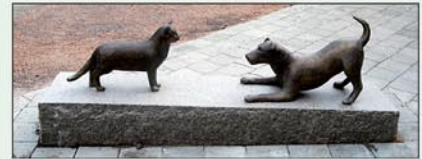
"Ska vi leka" från Zakrisdals vårdboende Karlstad.